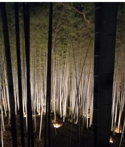
竹林ライトアップ