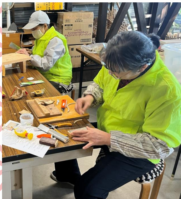
▲ パーツの調整・組立