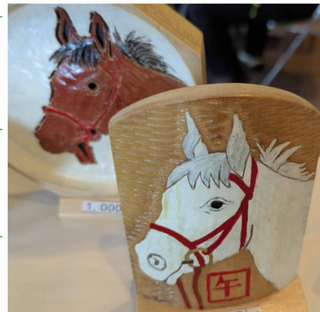
会員作 2026年干支の置物